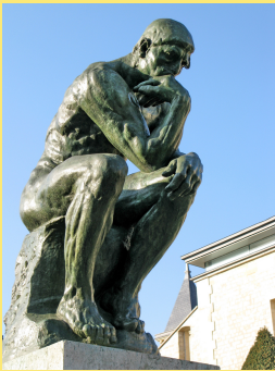
Le penseur, Auguste Rodin, 1903, bronze, 1,89 x 0,98 x 1,4 m, Paris

Une oeuvre est ABSTRAITE si : deux personnes peuvent voir des choses différentes.