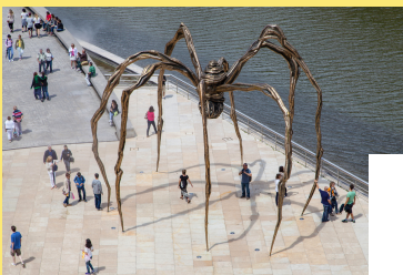
Maman, Louise Bourgeois, 1999, bronze, 9,27 x 0,891 x 10,23 m, Bilbao