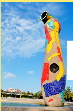
Dona y Ocell, Joan Miró, 1982, ciment, 5,29 x 22 x 3 x 3 m, Barcelone