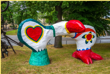
Le paradis fantastique, Niki de Saint Phalle et Jean Tinguely, 1967, Stockholm